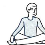
Je fais des activités sans effort