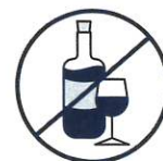
J'évite de boire de l'alcool