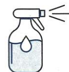
Je mouille mon corps