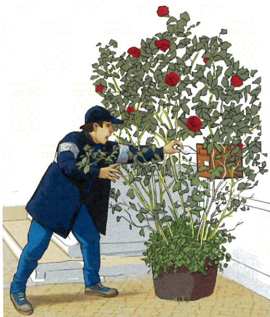
◀ Boîtes aux lettres inaccessibles ▶