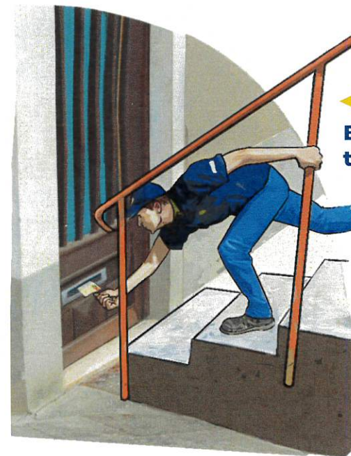
▶ Boîte aux lettres trop basse