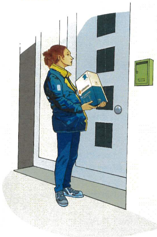
Boîte aux lettres trop petite ▼