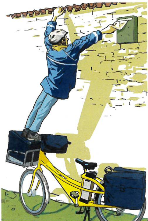
◀ Boîte aux lettres trop haute